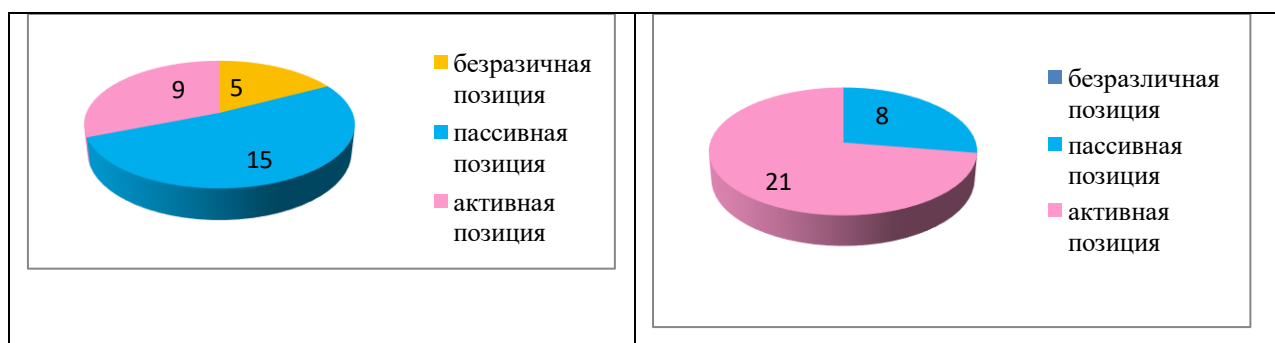
Диаграммы 1-2. Становление личностной позиции: начало и финал проекта

Самыми главными показателями стали: созданные условия для ситуаций, определяющих успешность воспитательного процесса, что отражено было в показателях социометрии; стремление к активной творческой и социальной деятельности; формирование дружного коллектива, сплочённого единой целью – мотивацией самосовершенствования собственных талантов и реализации его в коллективной деятельности.